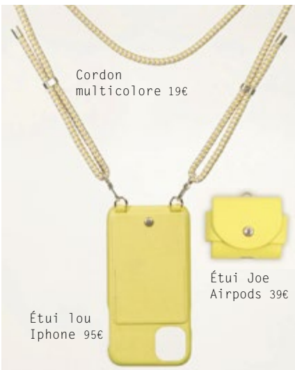
Cordon multicolore 19€